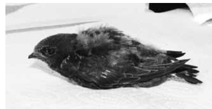
Abb. 3: Junger, 21 Tage alter Mauersegler; Körpergefieder schon recht weit entwickelt; grössere Flügel- und Schwanzfedern stecken noch zu mehr als der Hälfte in den Federscheiden

Das Gewicht ausgewachsener Mauersegler beträgt je nach Individuum zwischen 31 und 55 g, wobei Vögel mit weniger als 40 g meist untergewichtig sind. Den Ernährungszustand können wir durch Abtasten des Brustbeins ermitteln. Wenn dieses wie ein Messerrücken hervorsteht, ist der Vogel abgemagert. Er muss für den Aufbau der Muskulatur einer sachkundigen Person in einer Pflegestation übergeben werden. Entsprechende Adressen sind bei der Vogelwarte und beim Schweizer Vogelschutz SVS/BirdLife Schweiz erhältlich.