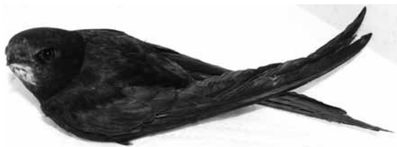
Abb. 1: Mindestens ein Jahr alter Mauersegler; helle Kehle, sonst einfarbig dunkles Gefieder ohne helle Federränder

Jungvögel sind nach dem Aufbrechen der Federscheiden (Abb. 2) an den hellen Federsäumen (vor allem an den Schwungfedern) und an der hellen Stirn gut zu erkennen (Abb. 3 und 4). Junge Mauersegler haben im Gegensatz zu den meisten jungen Singvögeln keine gelben Schnabelwülste.