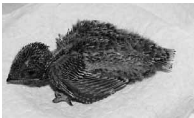
Abb. 2: Junger, 13 Tage alter Mauersegler; erste Federn durchbrechen die Scheiden