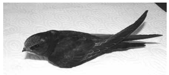
Abb. 4: Junger, 38 Tage alter und praktisch flügender Mauersegler; helle Federränder an Kopf und Flügeln deutlich sichtbar